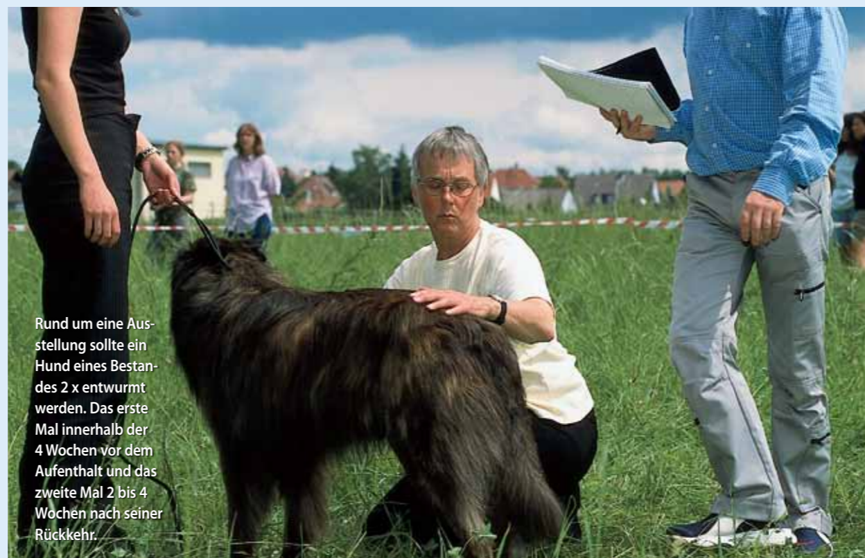
Rund um eine Ausstellung sollte ein Hund eines Bestandes 2 x entwurmt werden. Das erste Mal innerhalb der 4 Wochen vor dem Aufenthalt und das zweite Mal 2 bis 4 Wochen nach seiner Rückkehr.