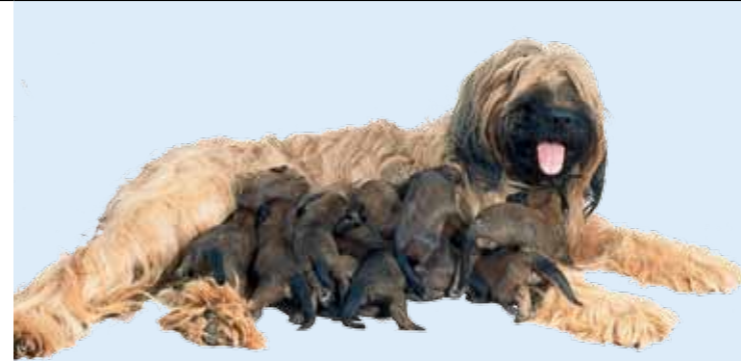
Um eine Übertragung von Würmern bereits innerhalb des Mutterleibes auf die Welpen zu verhindern, können die Hündinnen in Absprache mit der Tierarztpraxis im letzten Drittel der Trächtigkeit mit ausgewählten Präparaten gegen Würmer behandelt werden.

mer behandelt werden. Welche Form der Behandlung am besten geeignet ist, muss individuell besprochen werden. Unabhängig von dieser Behandlung innerhalb der Trächtigkeit sollten Muttertier und Welpen dann 2 Wochen nach der Geburt und die Welpen anschließend in 14-tägigen Abständen bis 2 Wochen nach der letzten Aufnahme von Muttermilch entwurmt werden. Tut man dies nicht, kann es zu einem massenhaften Wurmbefall der Jungtiere kommen, was bleibende Schäden verursachen und sogar zum Tod der Welpen